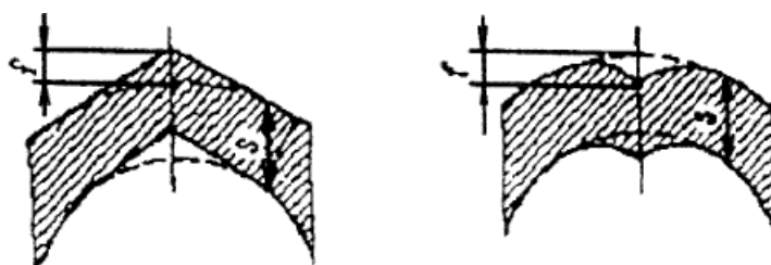
Рисунок 1. Увод (угловатость) кромок в сварных швах

71. Увод (угловатость) f кромок в сварных швах не должен превышать f=0,1s+3 мм, но не более соответствующих величин, указанных в таблице N 2 настоящих Правил для элементов сосудов (рисунок 1).